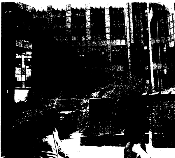
L'esterno del palazzo di Wind

ciale, per permettere anche a famiglie di fasce di reddito medio-basso di avere una casa. Si colloca sull'asse Roma sud-Pomezia-Aprilia-Latina il cosiddetto sistema produttivo chimico-farmaceutico del Lazio, con la presenza di grandi industrie e multinazionali. Ha sede a Pomezia, per esempio, la Sigma-Tau, uno dei più importanti gruppi farmaceutici con un totale di 2.512 dipendenti, di cui 400 impegnati nella ricerca (in cui viene investito il 16% del fatturato). Lo stabilimento di Pomezia copre quasi 291 mila metri quadrati, di cui 17.400 sono occupati dai laboratori. La Sigma-Tau è una delle poche aziende farmaceutiche che fa ricerca sulle malattie rare e, insieme a partner cinesi, studia le molecole di origine naturale, considerate molto promettenti per il futuro dell'industria.