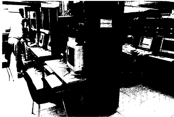
Il centro di ricerca Tivoli di Ibm