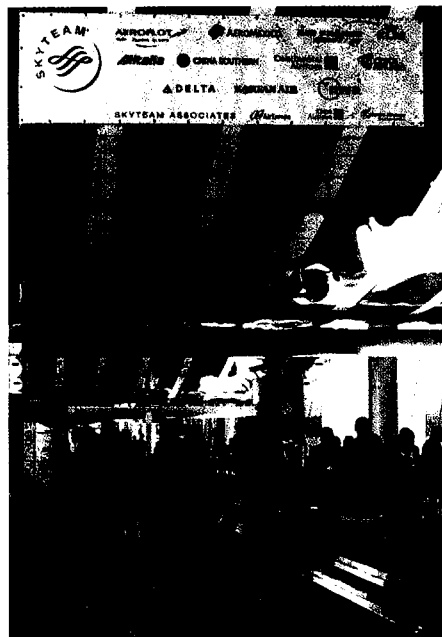
Una delle entrate della nuova Fiera di Roma

Segno di come Roma si modernizza, anche le aziende tradizionali, i colossi dei servizi e le utility oggi appaiono notevolmente rinnovate. Poste italiane ha innalzato la qualità delle attività e ampliato la gamma dell'offerta, dai servizi bancari alla telefonia mobile. Ha investito in tecnologie, infrastrutture e formazione ed è riuscita a chiudere i bilanci in utile negli ultimi sei anni, fatto storico dopo 50 anni di conti in rosso. Tan-