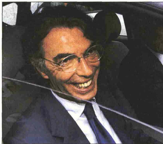
Massimo Moratti, presidente dell'Internazionale Fc: la sua strategia per reclutare talenti potrebbe essere mutuata dalla ricerca farmaceutica nazionale

Come dicevamo in apertura, l'Italia, fino a poche decine di anni or sono, disponeva di una ricerca scientifica dedicata al farmaceutico, che coinvolgeva molti studiosi e che aveva portato alla scoperta di sostanze affermatesi come farmaci di eccellenza in tutto il mondo. Oggi da noi una ricerca